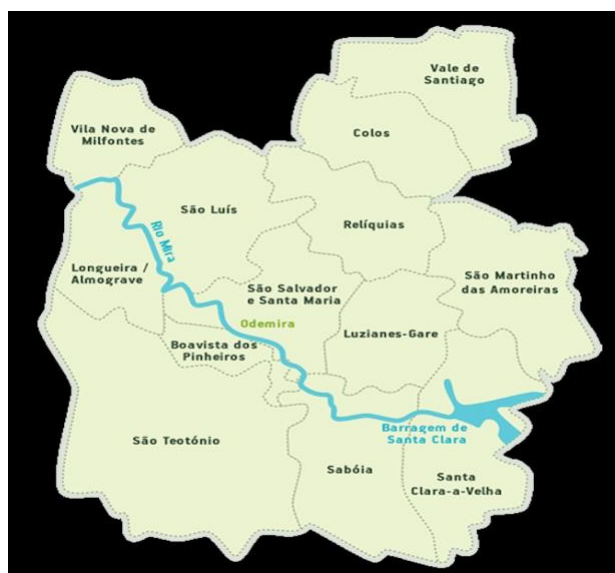
Figura 1. Mapa do Concelho de Odemira.

O concelho abrange uma extensa área litoral em desenvolvimento e um vasto território interior que padece de um lento processo de desertificação humana. Geograficamente integra a região sul do Alentejo Litoral, com notórias influências da serra algarvia tanto nas paisagens como no quotidiano das populações.