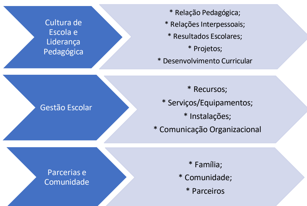
Figura 18 – Eixos de Intervenção

Esta estrutura organizacional reflete o compromisso do Agrupamento com uma Educação de qualidade, assente na articulação eficaz entre os processos pedagógicos, a gestão de recursos e o envolvimento da comunidade educativa alargada. Os três domínios estratégicos trabalham de forma sinérgica para criar as condições necessárias ao desenvolvimento integral dos alunos, permitindo-lhes adquirir as competências-chave definidas no PASEO: conhecimentos, capacidades e atitudes que os preparam para os desafios da sociedade contemporânea e para o exercício de uma cidadania ativa e responsável.