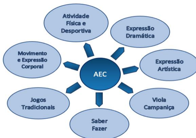
Figura 6. Temas das AEC implementadas no Agrupamento.

Visam ampliar horizontes e proporcionar experiências diversificadas nos domínios artístico, desportivo e ligação da escola com o meio, reforçando competências transversais essenciais para o sucesso escolar e para a cidadania ativa. Através de uma abordagem lúdico-pedagógica, promovem-se ambientes educativos positivos e inclusivos, valorizando a participação, a curiosidade e o espírito crítico dos alunos.