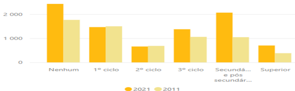
Figura 3. População residente, por nível de escolaridade, entre 2011 e 2021, na freguesia de S. Teotónio.

Em termos de escolaridade da população, os resultados da comparação nos níveis de escolaridade entre a população residente na freguesia de São Teotónio e a do restante concelho, apresentam semelhanças na maioria dos parâmetros apresentados. No entanto, há um dado discrepante entre a freguesia e o município, verificando-se um aumento da população residente na freguesia de São Teotónio, sem nenhum nível de ensino, enquanto a nível do município, esta evolução foi positiva tendo os valores reduzido na década em análise.